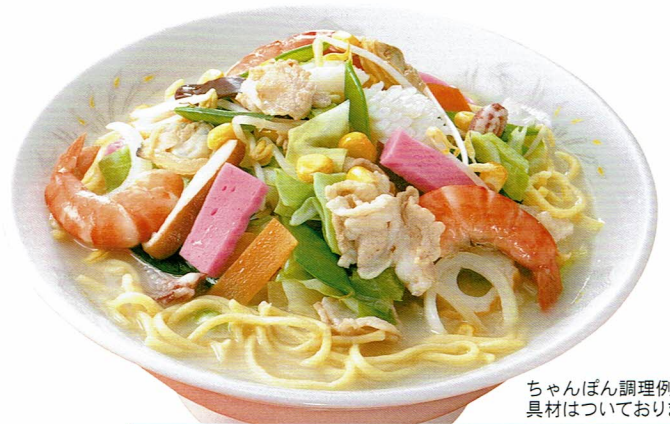
ちゃんぽん調理例 具材はついておりません