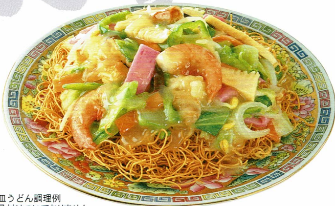
血うどん調理例 具材はついておりません